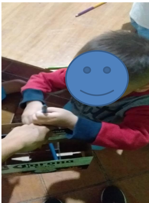
Figura 6: Niño participando del juego los amigos los números introduciendo en la caja dos colores