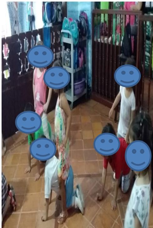
Figura 9. Carrera de caballos por pareja