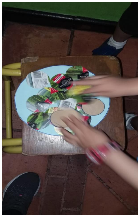
Figura 7: Niños y niñas escogiendo la figura geométrica del círculo