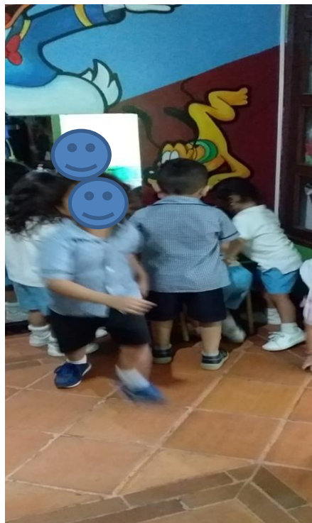
Figura 8. Juego de competencia sobre el tema del cuadrado y círculo