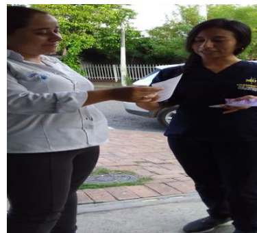
Figura 2. (Tena Cundinamarca. 2019 Jardín Dulce Corazón De María. Intervención con los padres.

Los padres de familia no tienen conocimiento sobre cada uno de los estilos de crianza que existen en los hogares sin embargo de una u otra forma están llevando uno de ellos, de acuerdo a la información planteada por ellos infortunadamente aplican el estilo de crianza permisivo y negligente el cual no son buenos para los niños ya que el primero carece de normas y límites dejando y el negligente se caracteriza por la ausencia de los padres de familia