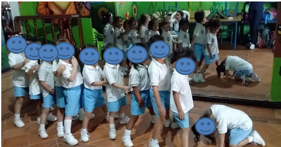
Figura 4 Niños y niñas formando una fila para jugar a imitar los animales