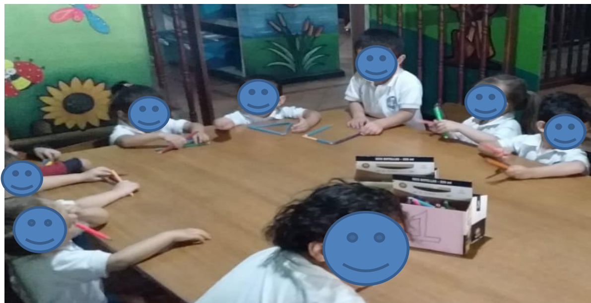
Figura 5. Iniciando la actividad de los números 1 y 2