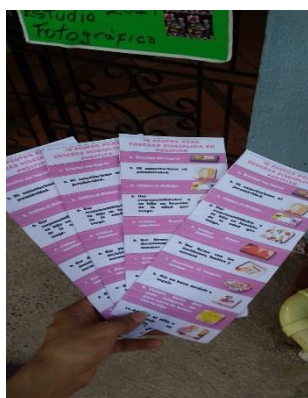
Figura 3. (Tena Cundinamarca, 2019 Jardín Dulce Corazón De María. Intervención con los padres.

Al finalizar la charla se complementó la información con la entrega de un folleto a los padres en donde había 10 pautas para aplicar disciplina en positivo en casa con sus hijos