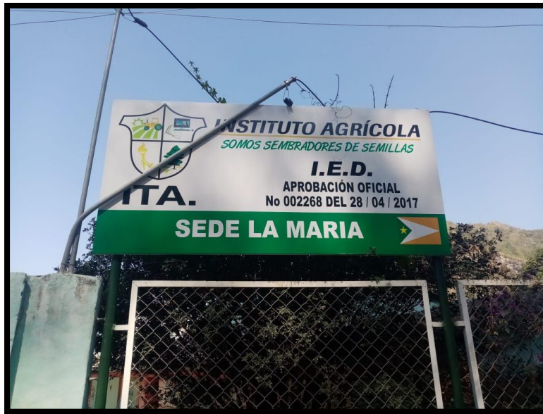
Foto N°2. Instituto Agrícola Sede La María