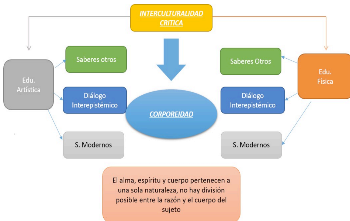
Figura 3 Esquema del Área de Arte y Movimiento

Nota. Para la integración de los saberes otros, la interculturalidad crítica se comprende como el tópico generador, bajo el cual se subalternizan la educación física y las artes, y la intersección entre estas, se da en la corporeidad.