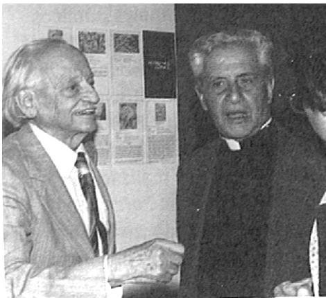
Pedro Nel Gómez, insigne representante del muralismo y de las artes plásticas en Colombia, realiza una muestra retrospectiva de sus trabajos en el MAC, le acompaña el P. García Herreros.

Incrementar las opciones para los creadores nacionales es la estrategia que se lee en el conjunto de proyectos y acciones ejecutadas en este año por el Museo de Arte Contemporáneo.