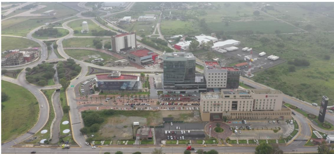
(Guanajuato Puerto interior, s/f)

Hoy se ha rebasado este compromiso, con el desarrollo de 1,277 hectáreas, en las que a tan sólo 15 años de inicio de operaciones y comercialización se han instalado más de 123 empresas, asegurando una inversión histórica por más de 4,500 millones de dólares y generando más de 27 mil empleos.