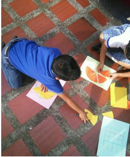
Estudiantes jugando con los fraccionarios