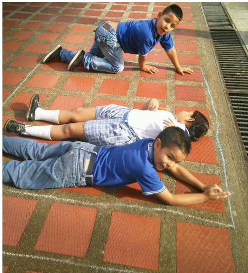
Estudiantes sumando y restando con el cuerpo en equipo colaborativo