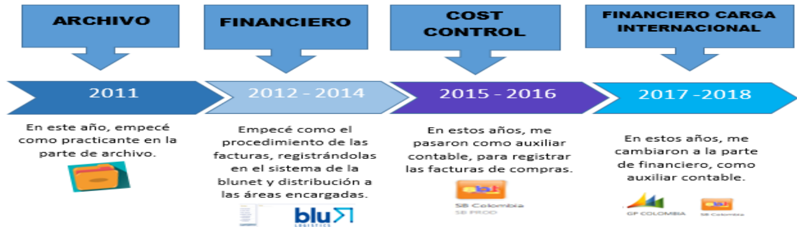
Ilustración 8 Línea de tiempo Áreas de Desempeño Laboral