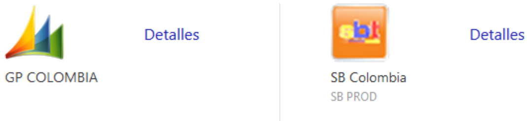
Ilustración 2 https://app.blulogistics.net/Citrix/BlulogisticsWebhttps://blunet.blulogistics.net/blunet/?xprOpenPopup=1

En la empresa Blu logistics S.A.S Colombia se utiliza dos sistemas contables que se llaman Silver Bullet, es un sistema de software; principal gestión de operaciones para importación y exportación, encargado del ingreso de las facturas operativas en compras y ventas, el otro sistema es Microsoft Dynamics GP es la solución ERP de clase mundial donde se contabiliza la parte administrativas, la contabilización de los lotes y otros procesos.